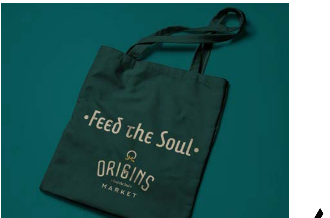
Origins Markets Busselton, Western Australia Creazione Identità Visiva & Design dei Materiali di Comunicazione

Un'elegante operazione di rebranding per un grande spazio commerciale di prodotti locali e artigianali a Busselton, Western Australia. Il progetto ha incluso il roll-out completo dell'identità visiva, la definizione delle linee guida del brand, la progettazione del sito web, template pubblicitari e segnaletica.