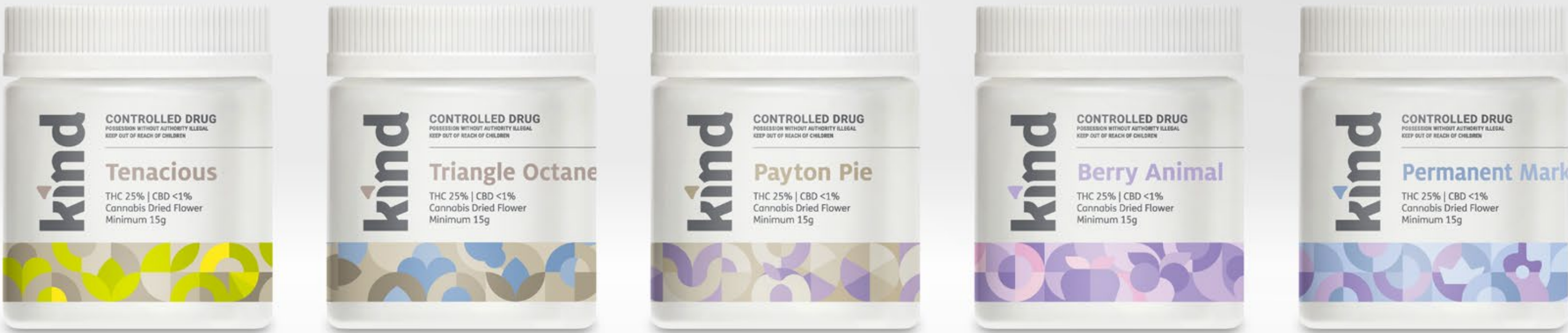
Kind Indoor Range Gamma di Prodotti Premium a base di Cannabis Design del Packaging e Illustrazione

Ambito di Progetto Design del Packaging Strategia Creativa Illustrazione